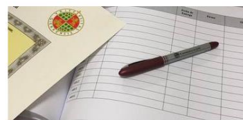
Recogida del Título Oficial (Grado)