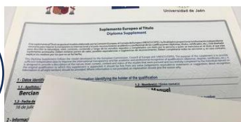
Suplemento Europeo al Título