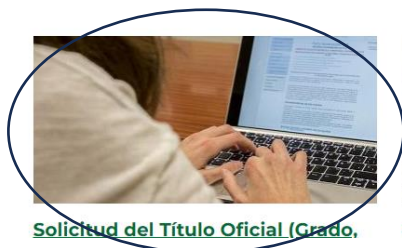
Solicitud del Título Oficial (Grado)

En cualquier caso, en cumplimiento de la Ley de protección de datos, este tipo de consultas no podrán ser atendidas telefónicamente, no obstante, podrá consultar el estado en que se encuentra su solicitud de título y Suplemento Europeo al Título (SET), accediendo con su cuenta TIC a Universidad Virtual Servicios Académicos/ Estado Solicitudes Título Oficial y SET .